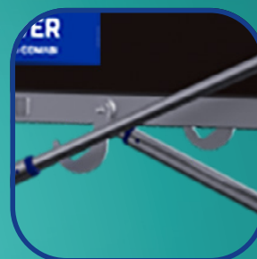
Ganchos para transportar la plataforma

AJUSTABLE CADA 25 CM DE 0,30 M A 1,80 M PLATAFORMA