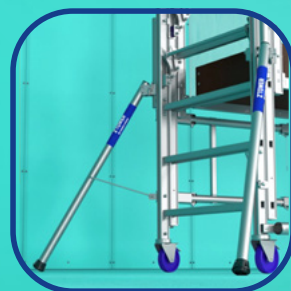
Estabilizadores retráctiles y orientables