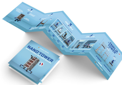
Folleto 5 hojas