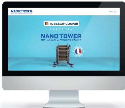
Página producto en el sitio web www.tubesca-comabi.international/es/nanotower