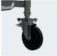
Verstellbare Räder Ø 200 mm